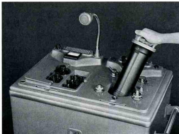
Einsetzen der Kassette in den TELEBILD-Empfänger

Der TELEBILD-Empfänger wandelt bei Negativ-Empfang die Lichtwerte mit elektronischen Mitteln in ihre Kehrwerte um. Damit die Negative außerdem spiegelbildlich entstehen, kann auf Wunsch ein Modul für umgekehrte Drehrichtung der Bildtrommel eingerichtet werden. Die Filmnegative können dann auch mit diffusem Licht kopiert werden.